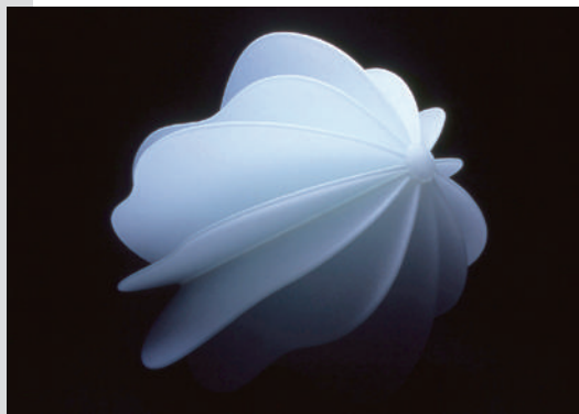
左上から：超錚玻璃主義/岡田克也/2019年/作家蔵 ヒのマ - 一踏一井上剛/2018年/作家蔵 樹海#1802/佐々木雅浩/2018年/作家蔵 間-Ma/奥野美果/2002年/作家蔵/撮影：Nobu あわい/小路口力恵/2008年/作家蔵