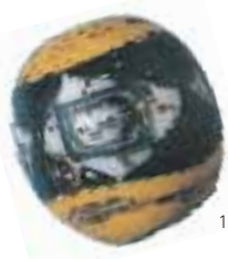
ヘレニズム～ローマ時代のガラス玉。金太郎アメのように、断面が人の顔の模様になるガラス片を作り、ガラスの表面に溶かしつけています。

本展では、古代の遺跡から発掘されたガラス玉、現代作家のガラス玉、ビー玉を使った体験型現代アート作品など、《歴史を知る》《技を見る》《体験する》の3つのテーマでガラス玉の世界をご紹介します。