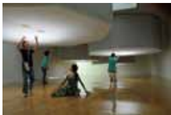
1.「人面貼付玉」東地中海沿岸域 前2～後2世紀 岡山市立オリエント美術館蔵 2.「彩雲」吉田美樹 3.4.「光であそぶ」アトリエオモヤ