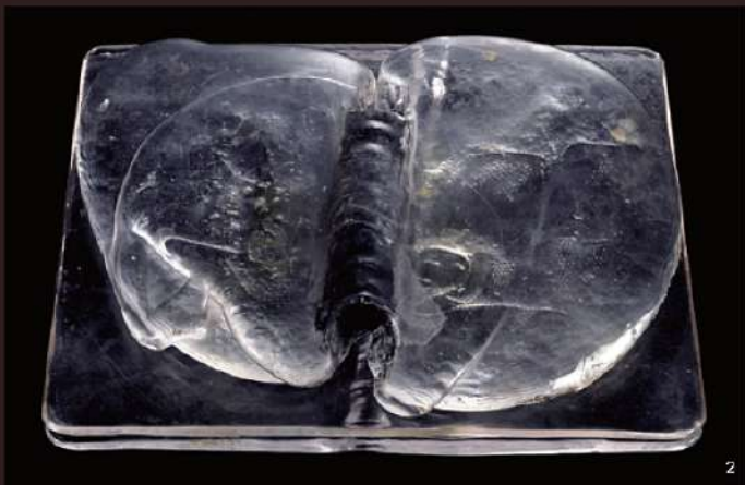
1. 西方へ/1994年/百合、桔梗、サルビア、ユウカリ、菫、金盞花、自作ガラス 撮影：中川幸夫 2. ぼくの思慕記/1990年/椿人鏡 撮影：高橋章 3. 花神に/1975年頃/椿人鏡 撮影：高橋章 4. 船/1975年/貝、自作ガラス、撮影：新居義久 5. 花坊主/1973年/カーネーション800本、自作ガラス 撮影：牧直視