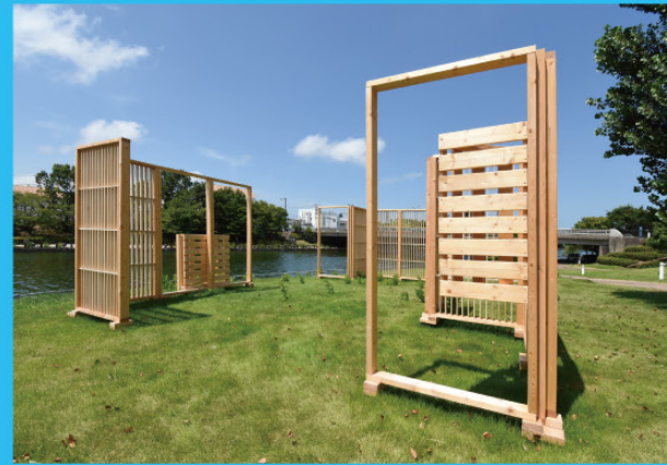
建築的な / 2019年 / 展示風景：「ビエンナーレ TOYAMA 2019」 富岩運河環境公園 2019年