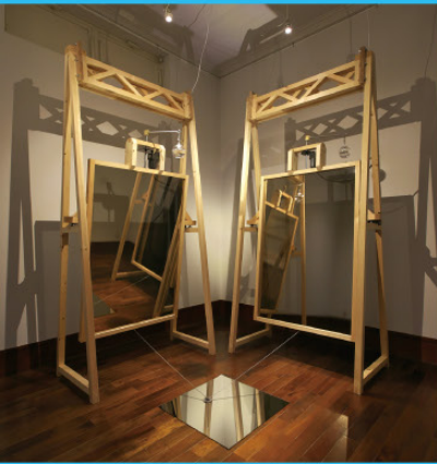
風景装置 #2 / 2020年 / 展示風景：「風景装置」 じょうはな美術館 2020年

「みること」をテーマに鏡を用いたインタラクティブな作品を発表している本郷仁の個展。鏡の反射によって外界の風景を取り込んだ作品は、私たちの認知を揺さぶり、普段何気なく行っている「みる」という行為をあらためて意識させる装置となります。内側と外側の境界が曖昧になり、人や物との距離感がわからなくなるような非日常的な視覚体験と、日常的な行為や風景との間を行き来しながら、世界との関わり方を探ります。