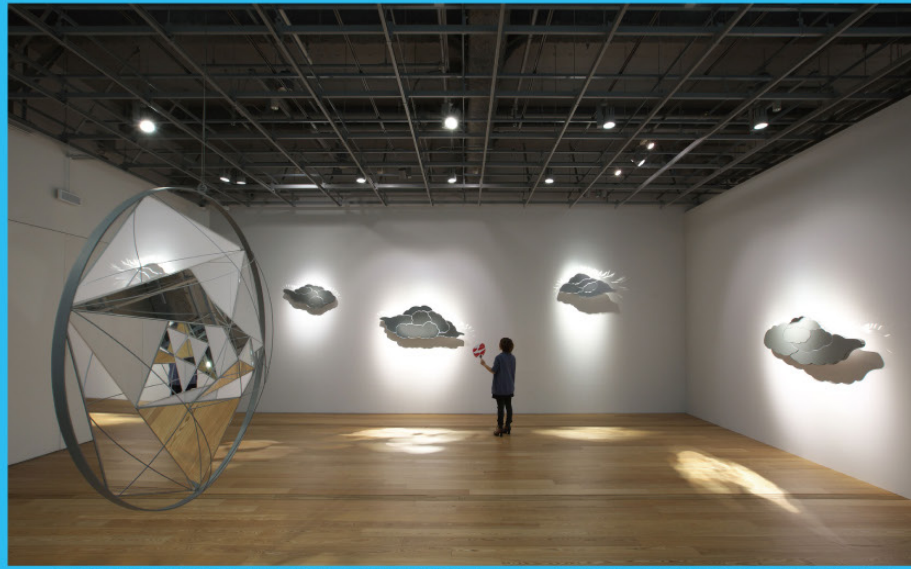
左：月と眼とは似ている／2015年 右：風のまにまに／2013年／展示風景：「feeling in glass 一感じとるかたち」 富山市ガラス美術館 2016年