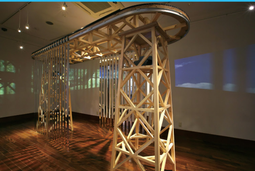
風景装置 #1 / 2020年 / 展示風景：「風景装置」 じょうはな美術館 2020年 ※掲載作品の一部は本展出品作品の参考作品、全て作家蔵