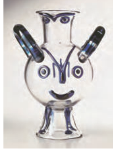
'익살맞은 올빼미' 에지디오 코스탄티니 (피카소의 디자인을 바탕으로) 1962년