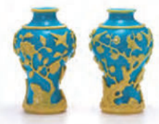
'청지황피화조문병'(靑地黃被花鳥文瓶) 중국(청나라) 18세기