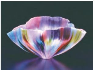
'Ultimo Danza Serena' 투스 진스키 2000년