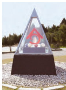
상징 조형물 '장'(藏) 후지타 교헤이 1997년