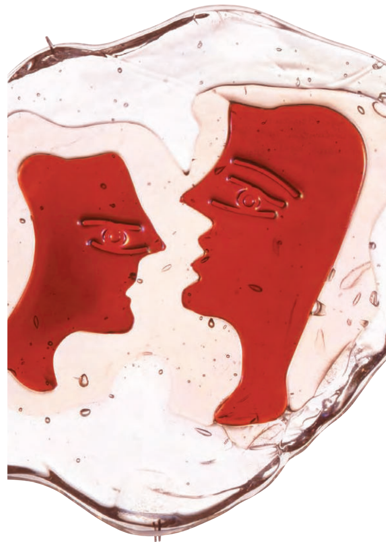
'만남-연인들' 에지디오 코스탄티니(조르주 브라크의 디자인을 바탕으로) 1954년