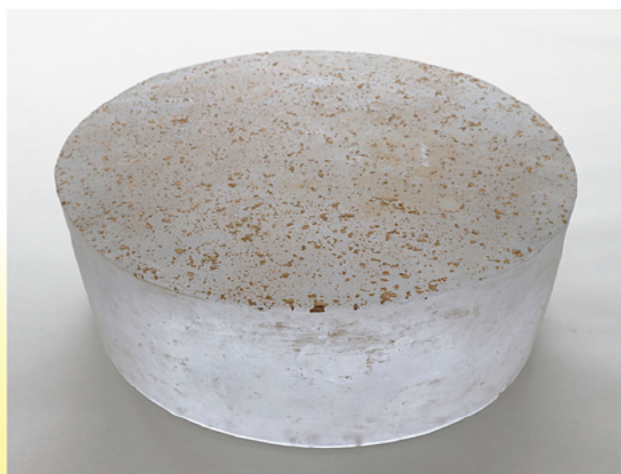
大地、或いは大気/扇田克也/2015年/作家蔵

本展は、光とガラスとの関係性を見つめ、造形表現に取り組む作家たちによる展覧会です。光によって引き立つガラスの表情と、そこに見えてくる「なにか」の気配を感じとることで、鑑賞者が新たな気づきを得る機会となれば幸いです。