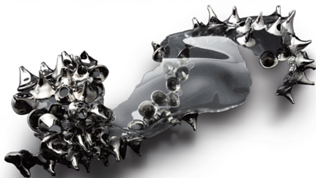
樹海 #2011/佐々木雅浩/2020年/作家蔵