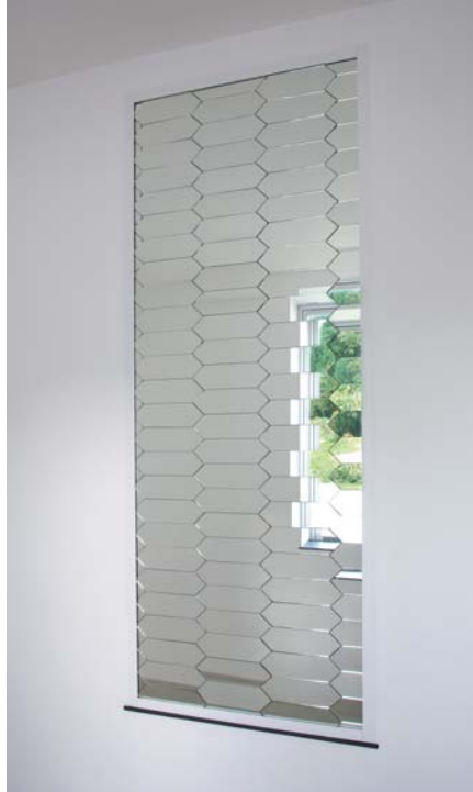
光廊／本郷仁／2011年／石川県能登島ガラス美術館所蔵 *写真は作品の一部

また、会期中にはガラス素材、ガラス工芸を体験できるイベントも多数開催します。現代ガラスアートの不思議な世界へみなさんをご案内します。