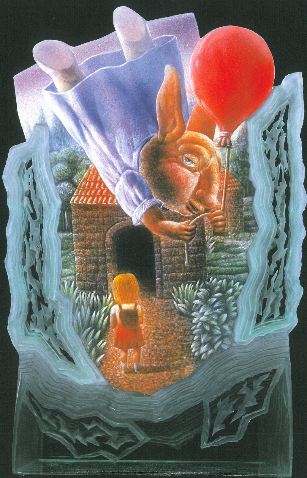
SCENE 'LOVE IT' 1998 池本一三 1998年 富山市教育委員会所蔵

会期 2006年 10月21日 (土) — 2007年 1月15日 (月) 休館日：11月21日(火)、12月19日(火)、12月29日(金)～1月1日(月)