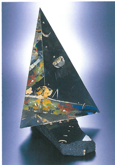
小惑星M308/ヤン・ソリチャック/1995年