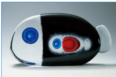
育まれしもの「いのち」/小林真/2008年/個人蔵