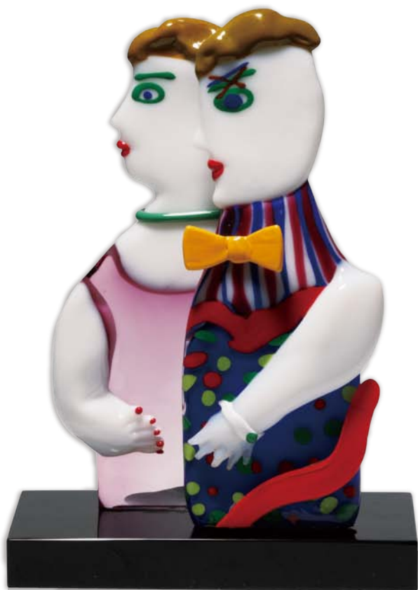
絹谷幸二「カップル」1994年 ガラス