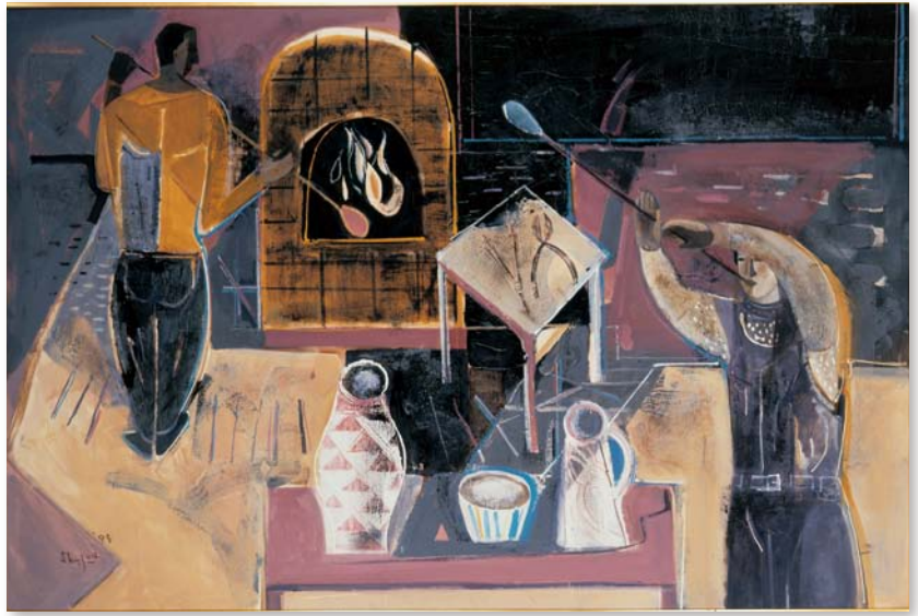
島田章三「ガラスをつくる人」1994年 油彩、カンヴァス