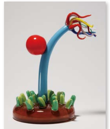
小杉小二郎「ムラノの朝」2009年 ガラス