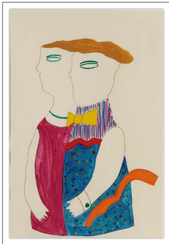
「カップル」原画 水彩、紙