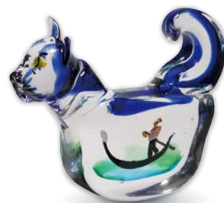
佐藤泰生「猫の中のベニス」2009年 ガラス