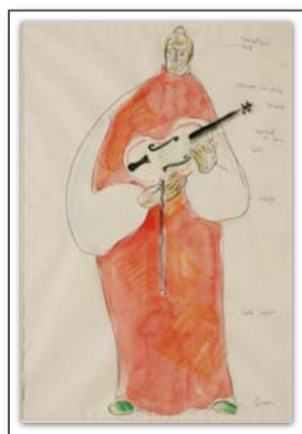
「演奏前1」原画 水彩、紙