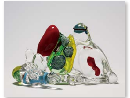
田村能里子「駱駝の背骨」2009年 ガラス