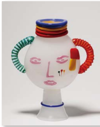
大沼映夫「虹の顔」1994年 ガラス