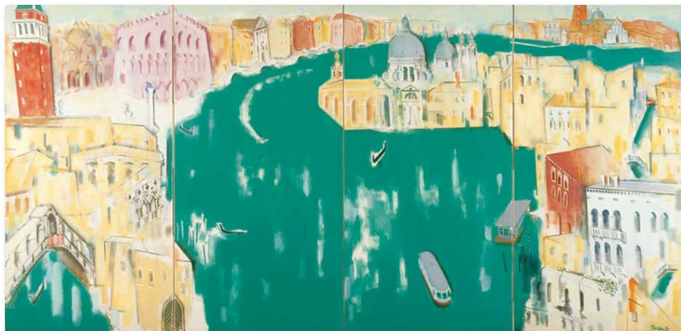
佐藤泰生「ベニス」1989年 油彩、カンヴァス