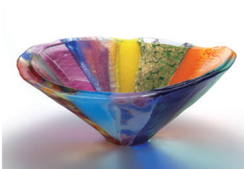
百彩鉢/神田正之/2007年/撮影：岡村喜知郎