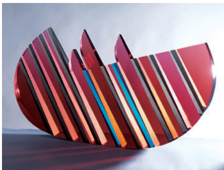
時の船/バヴェル・フラヴァ/1998年