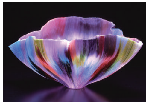
ラスト・ダンス/トゥーツ・ジンスキー/2000年