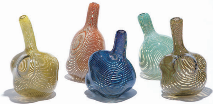
スウェリング・ボトル/志賀英二/2001年