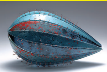
My Gray Days / マルタ・ギビエテ / 2019年