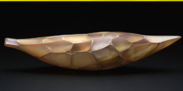
光と色の表出 / 若色正太 / 2018年

左：Amorphous 19-1 / 横山翔平 / 2019年 右：Blooming / 姜旻杏 / 2015年 ※掲載作品全て石川県能登島ガラス美術館蔵