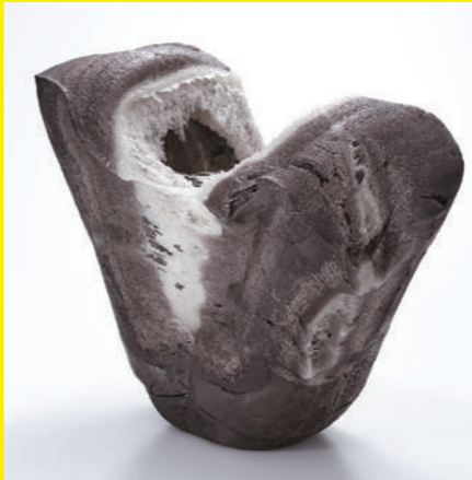
胎動 '19-3 / 津守秀憲 / 2019年