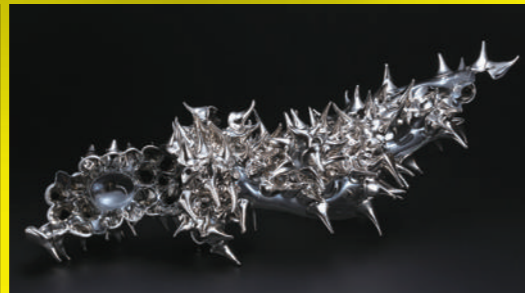
樹海 #1901 / 佐々木雅浩 / 2019年